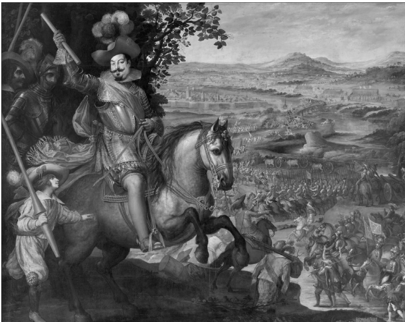
Socorro de la plaza de Constanza. Vicente Carducho (1634).

dávivas y pensiones que el rey otorgaba con cargo a uno u otro capítulo de las rentas a nobles y eclesiásticos, sin olvidar además los pagos para ganarse a personajes de la élite política y social de países rivales o aliados inestables.