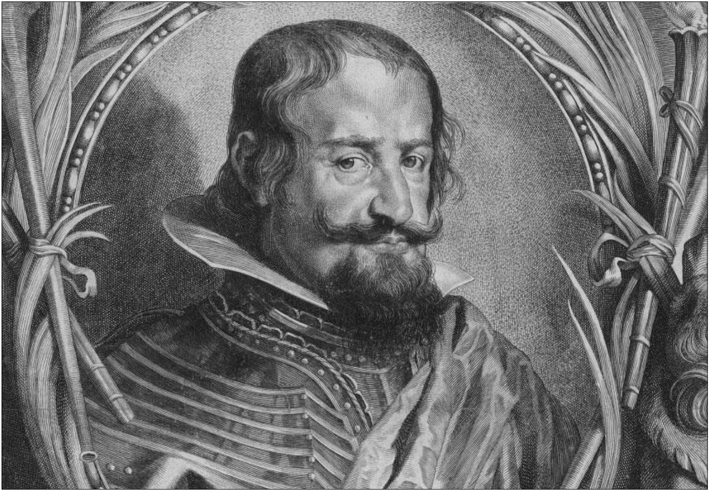
Gaspar de Guzmán y Pimentel Rivera y Velasco de Tovar, Conde-duque de Olivares.

pudo lograrlo, pero dejó trazada una senda que conduciría finalmente a ese desenlace.