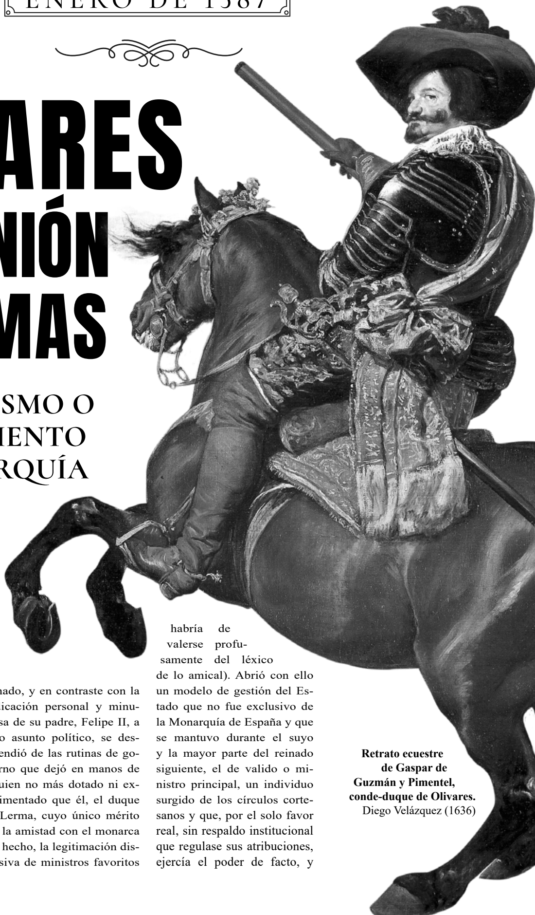
Retrato ecuestre de Gaspar de Guzmán y Pimentel, conde-duque de Olivares. Diego Velázquez (1636)

habría de valerse profusamente del léxico de lo amical). Abrió con ello un modelo de gestión del Estado que no fue exclusivo de la Monarquía de España y que se mantuvo durante el suyo y la mayor parte del reinado siguiente, el de valido o ministro principal, un individuo surgido de los círculos cortesanos y que, por el solo favor real, sin respaldo institucional que regulase sus atribuciones, ejercía el poder de facto, y