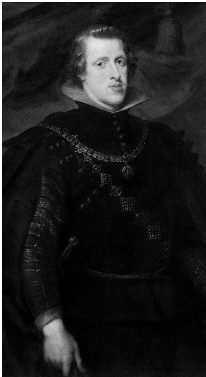
Retrato de Felipe IV de España. Rubens (1628).

Ningún territorio de la Monarquía, en Flandes, en Portugal, o en menor medida en Italia contribuía de modo significativo a costear los gastos que podrían considerarse comunes o generales. Salvo pequeñas cantidades, habitualmente procedentes de rentas o derechos propios del rey, lo recaudado en cada lugar se consumía en su administración, teniendo frecuentemente que llegar desde Castilla recursos para su defensa. La misma situación se producía en los reinos de la Corona de Aragón. Tanto en el de Valencia, el de Aragón propiamente dicho, el de Mallorca o el Principado catalán los reyes sólo disponían en la práctica de poco más que el derecho al quinto de los impuestos sobre el comercio, que cobraban ciudades o particulares, e incluso eso no se percibía en la mayoría de los casos. Los subsidios que ocasionalmente, y tras forcejeos, concedían las respectivas Cortes eran contribuciones extraordinarias y se compensaban con otras exenciones y beneficios, de modo que en nada reparaban el vicio estructural del sistema hacendístico. A cualquier