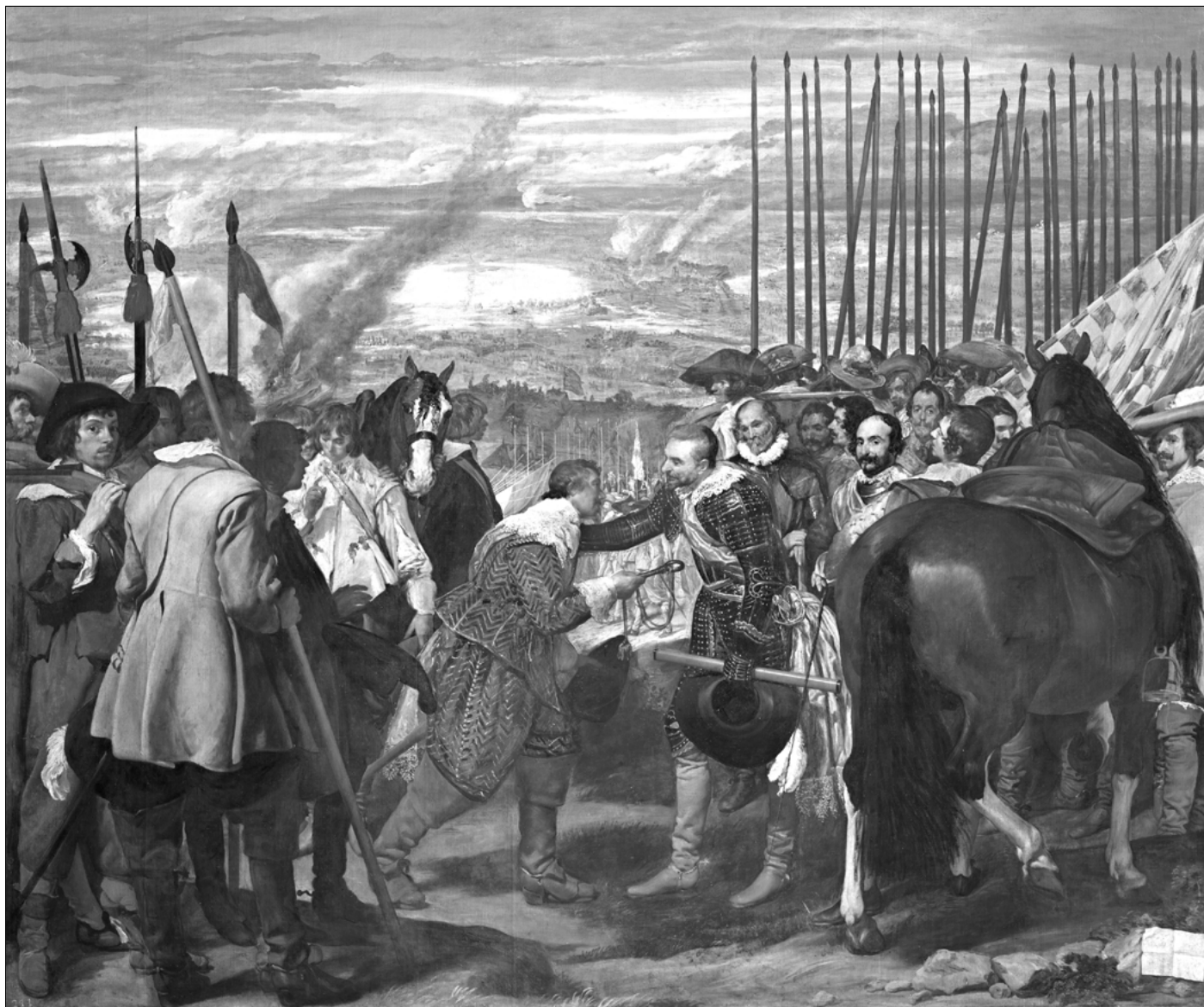
La rendición de Breda. Velázquez (1634).

virrey de Nápoles y Sicilia, de modo que desde la infancia conoció el ambiente de la alta política. Destinado a la carrera eclesiástica, la muerte de su hermano, mayorazgo de la casa, le convirtió en heredero del título y le orientó a la corte, donde fue gentilhomme del futuro Felipe IV. Fue ganando su confianza a la sombra de su tío, Baltasar de Zúñiga, ayo del heredero. Éste, adolescente inmaduro y voluptuoso, encontró en Olivares la persona a quien confiar el gobierno de asuntos que ni le apasionaban ni acababa de conocer, manteniéndole como válido hasta 1643, de modo que suyas fueron las decisiones y acciones importantes de aquellos años plagados de complicaciones internacionales e interiores.