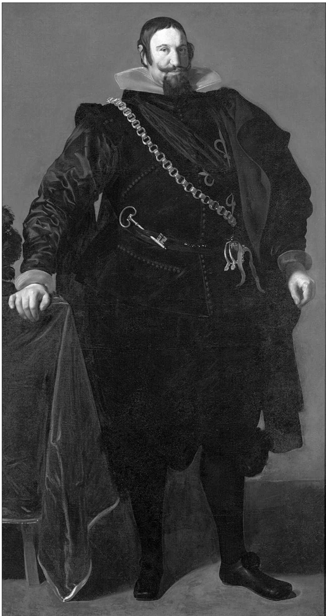
Retrato de Gaspar de Guzmán. Diego Velázquez (1624).

Los panegiristas del reinado destacaban que bajo Felipe III y su ministro la Monarquía conservó íntegra su soberanía territorial, con la misma extensión heredada de Felipe II, y con ello un valor intangible, pero vital para los criterios políticos vigentes: la "reputación". No cabe atribuirlo a habilidad o acierto de uno u otro, sino más bien a un elenco de diplomáticos y militares muy capaces quienes en sus respectivos destinos suplieron la falta de ideas claras y resolución del válido y del propio monarca. En contraste con el continuo guerrear de los dos reinados precedentes, el de Felipe III fue esencialmente pacífico, tras las treguas acordadas en sus primeros años con Inglaterra y los rebeldes holandeses de las Provincias Unidas. En esencia, aquellas paces consistieron en hacer de la necesidad virtud, porque lo cierto es que la Hacienda y los recursos humanos de la Monarquía, que eran sustancialmente los que Castilla pudiera proporcionar, estaban exhaustos y difícilmente podría haberse hecho frente a las exigencias de nuevas campañas. Lejos de trazar un programa de recuperación económica que sanease las bases del poder imperial, la prianza de Lerma actuó en sentido contrario. No ya por sus propias depredaciones y robos, o los de sus clientes, sino por la inagotable serie de