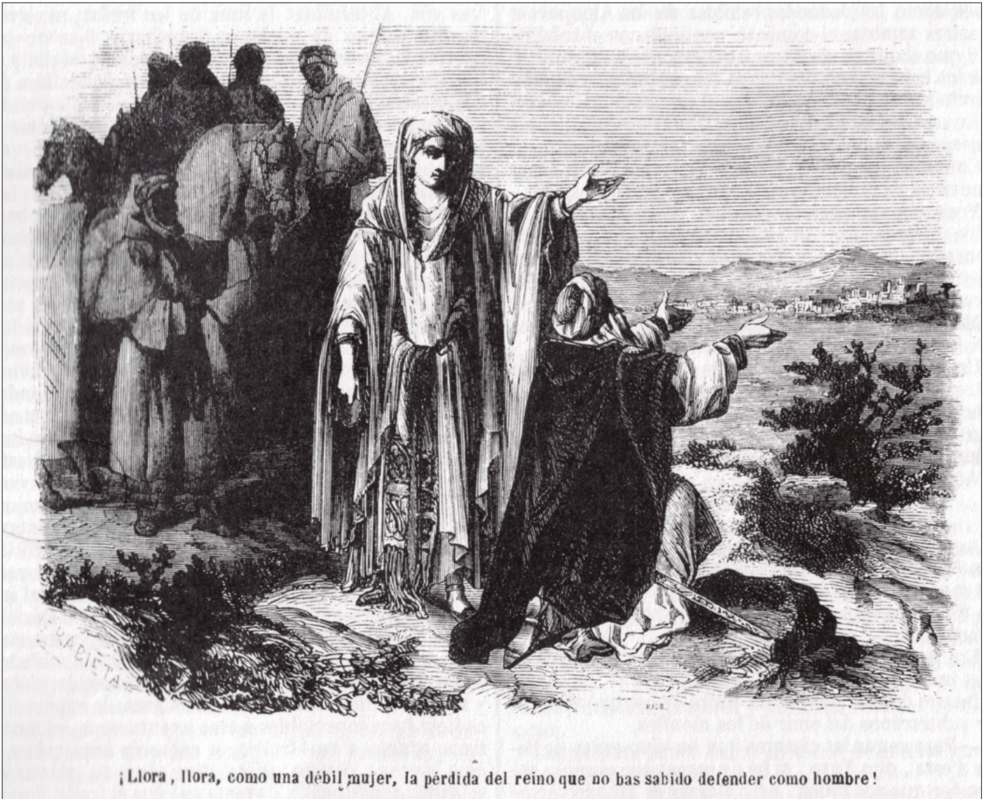
Los Monjes de las Alpujarras. Ilustración de Daniel Urrabieta y Vierge (1859).