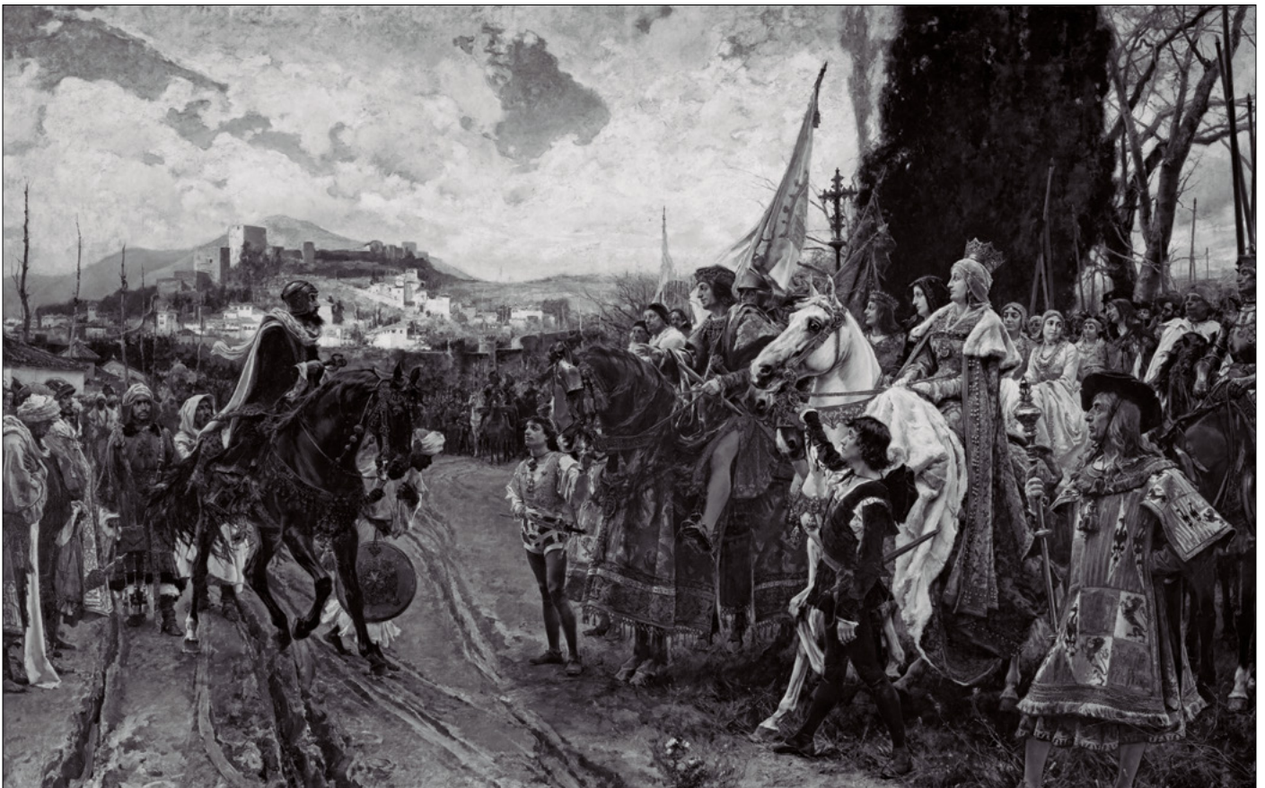
La Rendición de Granada - Pradilla (1882).

En el Archivo General de Simancas, dentro del denominado “Cubo de Felipe II” (donde se custodiaban los documentos más importantes del patronato regio de la Corona de Castilla), la antigua inscripción de un