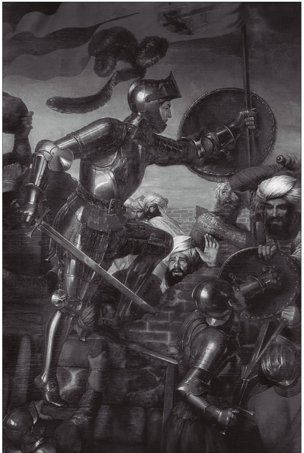
El Gran Capitán en el asalto de Montefrío. José de Madrazo. Alcázar de Segovia.

El sitio a la capital nazarí se vio jalonado por distintas operaciones llevadas a cabo por uno y otro contendiente desde abril de 1491. Juan de Mata Carriazo describe la campaña como una serie de episodios caballerescos, de tipo medieval, en donde los caballeros granadinos combatían con el valor temario del que se sabe sin salida y sin posibilidad de recibir ayuda exterior, “mientras Boabdil negocia y contemporiza” 3 . Las tropas castellanas, con la eficacia que otorga la superioridad, se instalaron en un campamento de obra en la villa de Santa Fe, después de que el fuego destruyera el establecido anteriormente, una señal de que no se marcharían hasta la rendición de Granada. También intercalaban las talas de la Vega, fuente de abastecimiento de la capital, con acciones militares, como la llevada a cabo en La Zubia, que supuso la aniquilación de lo que quedaba de la caballería nazarí. En una de estas cabalgadas moría el famoso Doncel de Sigüenza. En consecuencia, los sitiados vieron mermados sus fuerzas y su ejército y, llegado el invierno, se hizo insostenible la escasez en la ciudad. Un