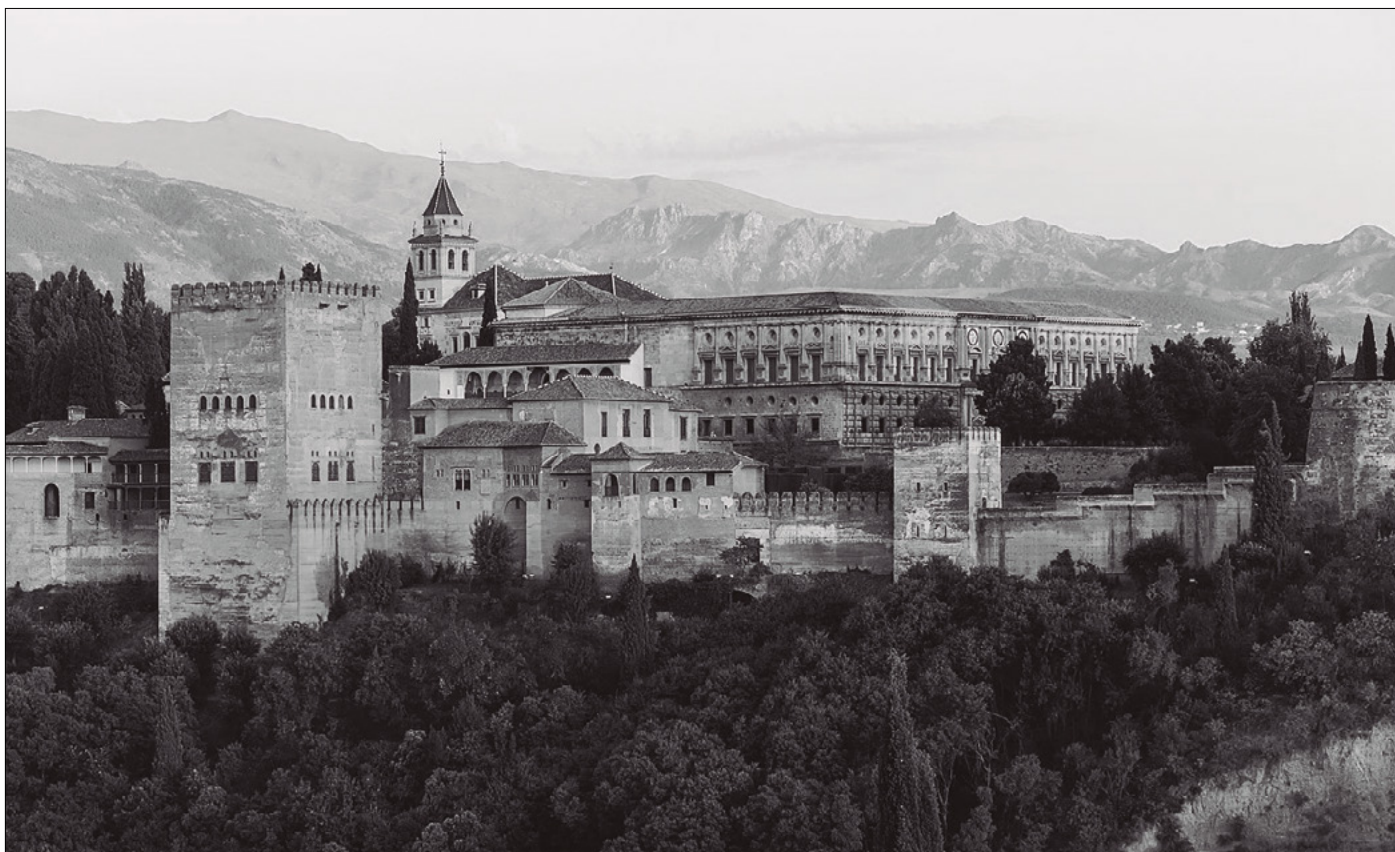
La Alhambra de Granada.

varios encuentros de especial virulencia entre castellanos y nazaríes, y después de un intenso bombardeo a la localidad, la ciudad se rendía. Siguió campañas duras, largas y costosas, con la participación de miles de jinetes y peones proporcionados por villas y grandes de Castilla, y con un importante esfuerzo logístico al servicio del aparato bélico; los resultados fueron las incorporaciones de Málaga (1487) y de Baza (1489), tras meses de asedios, fuertes combates e importantes pérdidas humanas y económicas. Sin embargo, por otro lado, tras la conquista bastetana, el subsiguiente desplome de la franja oriental del reino nazarí de Granada (se entregaron sin lucha Purchena, todos los lugares de la comarca del Almanzora, la Sierra de Filabres, Almería, Guadix y la zona del Cenete) es explicado por Miguel Ángel Ladero Quesada en la clave de que, tras una demostración de fuerza por parte de Castilla, la política flexible de capitulaciones podía atenuar las consecuencias de la conquista y acelerar el fin de la