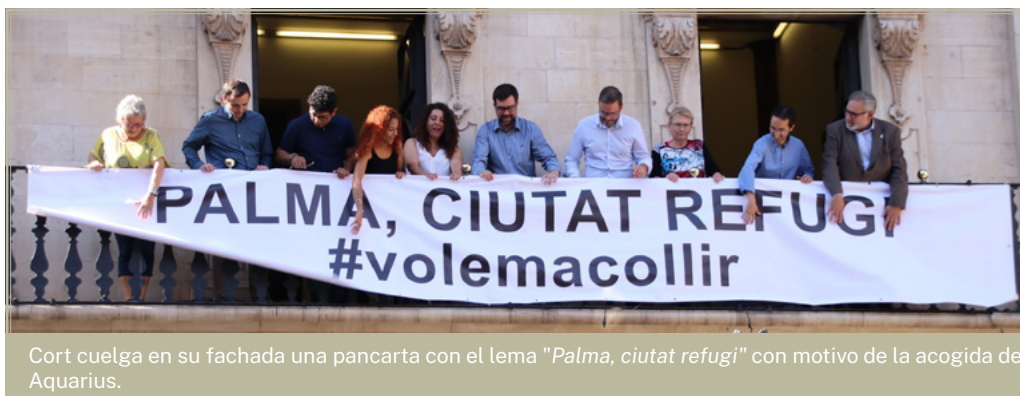
Cort cuelga en su fachada una pancarta con el lema "Palma, ciutat refugi" con motivo de la acogida del Aquarius.

flexible " que era uno de los argumentos de defensa de las devoluciones en caliente por parte del Partido Popular.