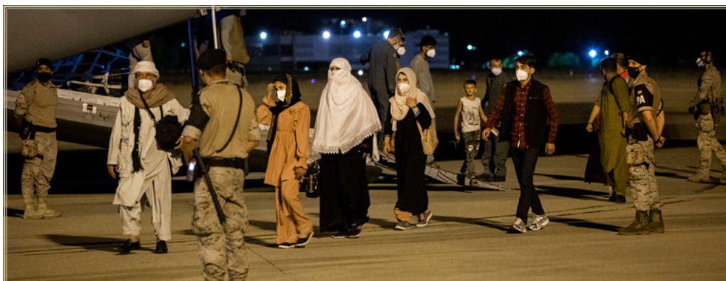
Varias personas evacuadas de Kabul llegan a la pista tras bajarse del avión A400M.

Así ha sucedido ya con motivo de la invasión rusa de Ucrania que, además de la muerte y la devastación, ha ocasionado, como señala el Alto Comisionado de las Naciones Unidas para los Refugiados, que casi 4,5 millones de personas hayan salido de Ucrania. Ante esta situación, los Estados miembros de la UE se preparan para acoger grandes números de refugiados. Sin embargo, pocos quieren reeditar lo que sucedió en 2015. Un buen ejemplo son las declaraciones de la primera ministra sueca, Magdalena Andersson, quien anunció en marzo que Suecia haría su parte para ayudar a los refugiados ucranianos,