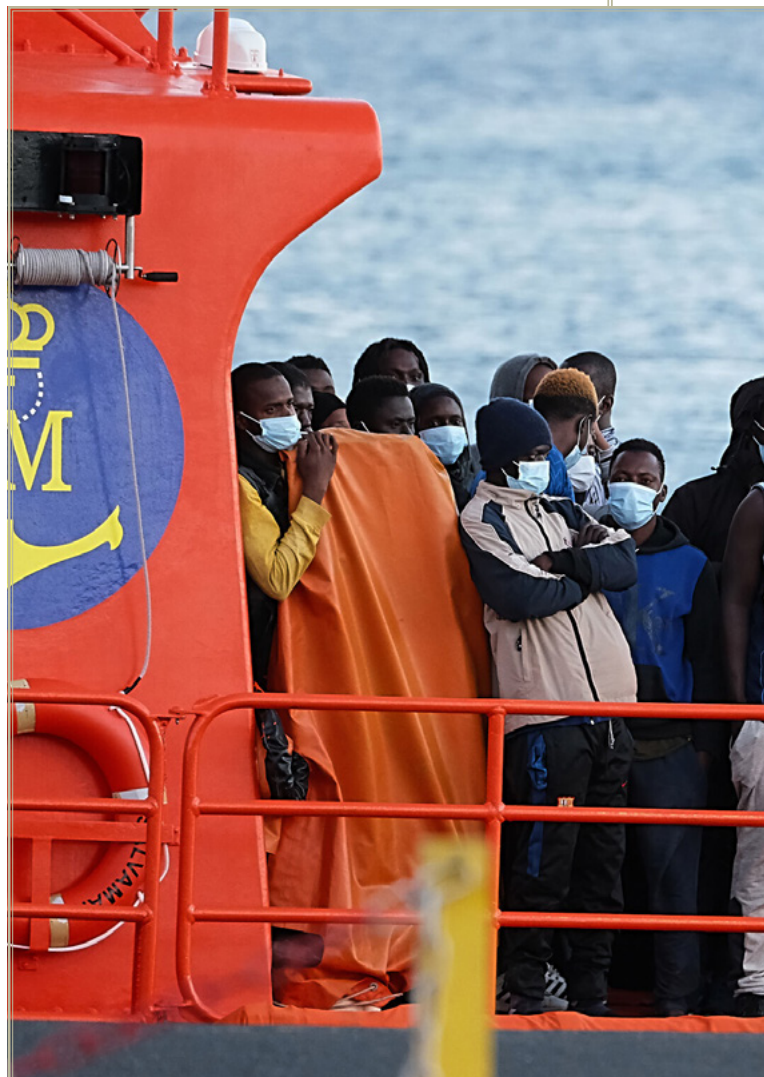
Migrantes llegan a tierra tras el rescate del buque Salvamar Mizar.

El debate acerca del fenómeno de la inmigración en España era prácticamente inexistente hasta hace apenas unos años. Todo lo contrario que en la mayoría de los países europeos, donde esta cuestión ha sido desde hace una década uno de los pilares más importantes de la discusión política a la par que ha tenido una repercusión transformadora, impulsando a nivel nacional a la Liga Norte de Matteo Salvini en Italia, consolidando el largo dominio de Fidesz en Hungría, provocando en gran medida el desgaste y relevo de Angela Merkel al frente de la UCD alemana. Pues bien, finalmente, España parece haber asumido también este debate a la luz de determinados sucesos que han situado la inmigración —en particular, la ilegal— en el foco político y mediático. En concreto, destacan tres eventos: el asalto a Ceuta y Melilla que tuvo lugar en mayo de 2021, el creciente peso mediático de los crímenes cometidos por inmigrantes ilegales (muchos de ellos, de índole