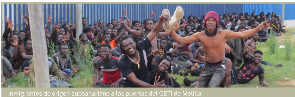
Inmigrantes de origen subsahariano a las puertas del CETI de Melilla.

Una vez realizada la aclaración terminológica anterior, corresponde adentrarse ahora en el análisis de la inmigración en España. En él se realiza una instantánea de la inmigración en nuestro país, basada en datos objetivos y alejada de usos partidistas, ideológicos o, simplemente, interesados. A su vez, se dibujan también los principales trazos del debate existente en nuestro país (similar al que tiene lugar en otros países de nuestro entorno) con el fin de comprender mejor su dinámica y argumentos. A continuación, se mencionan los principales desafíos en materia de inmigración para los próximos años. Finalmente, se enumeran una serie de propuestas para acometer los citados retos.