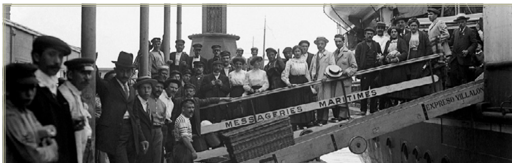
Foto de inmigrantes europeos desembarcando en Argentina.

importancia, como asuntos de seguridad, la sostenibilidad del estado de bienestar, la alarma demográfica, la estabilidad social e incluso la idea de nación. Por último, la incuestionable relevancia de este fenómeno se ve acentuada por el hecho de que ciertas formaciones políticas instrumentalicen la inmigración, realizando un uso partidista de este fenómeno con fines electorales.