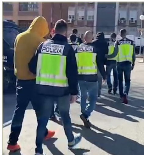
Miembros de los Trinitarios y DDP detenidos.

En este sentido, y pese a la presencia de numerosas pandillas procedentes de Iberoamérica (en especial, de América Central) en España, la población iberoamericana está