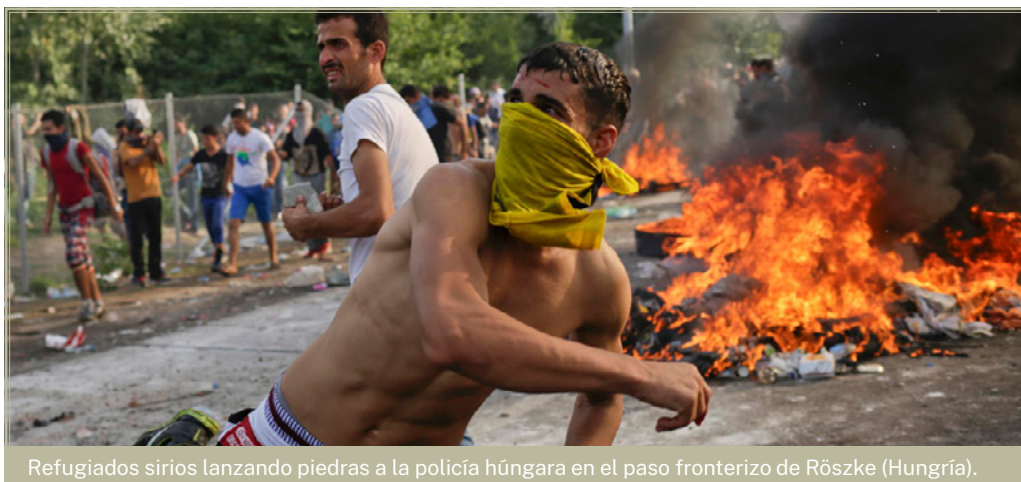
Refugiados sirios lanzando piedras a la policía húngara en el paso fronterizo de Röszke (Hungría).

Lukashenko, todavía hay 8.000 inmigrantes fruto de esta operación de “migración armada” 17 . En este punto, el precedente sentado por la UE con Turquía no ha hecho sino generar un “efecto llamada” de países que buscan el soborno de las instituciones europeas a través del mercadeo con seres humanos. Baste recordar aquí que, actualmente, y según apunta la ONG Amnistía Internacional, Turquía alberga a 4 millones de personas refugiadas, de las cuales 3,6 millones proceden de Siria, para cuya tutela la UE firmó un contrato con el país otomano de 6.000 millones de euros 18 .