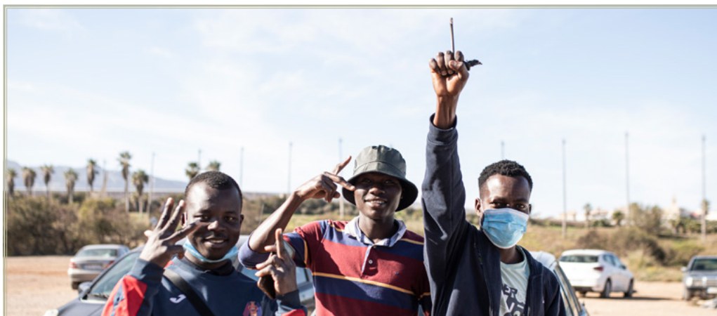
Inmigrantes procedentes de Marruecos, tras saltar la valla de Melilla.

Quizá el ejemplo más paradigmático de este tipo de comportamiento donde el discurso y las acciones no siempre van de la mano sea el del actual Gobierno de coalición entre el Partido Socialista y Unidas Podemos, en especial en lo que se refiere a las denominadas devoluciones en caliente . Estos dos partidos han estado en contra de este tipo de actuaciones por parte de las fuerzas de seguridad del Estado y, sin embargo, se aprecia un continuo cambio en el discurso y en la actuación en función del panorama nacional y la presión de la inmigración.