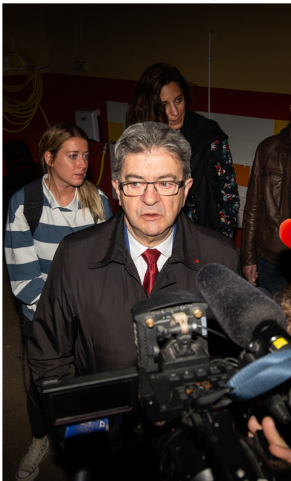
Jean-Luc Melenchon candidato presidencial de LFI.

con una tendencia mucho menos pronunciada, también en las zonas rurales donde Mélenchon obtuvo la victoria, Marine Le Pen ha conseguido buenos resultados. Macron, por el contrario, de entre los enclaves insumisos, solo