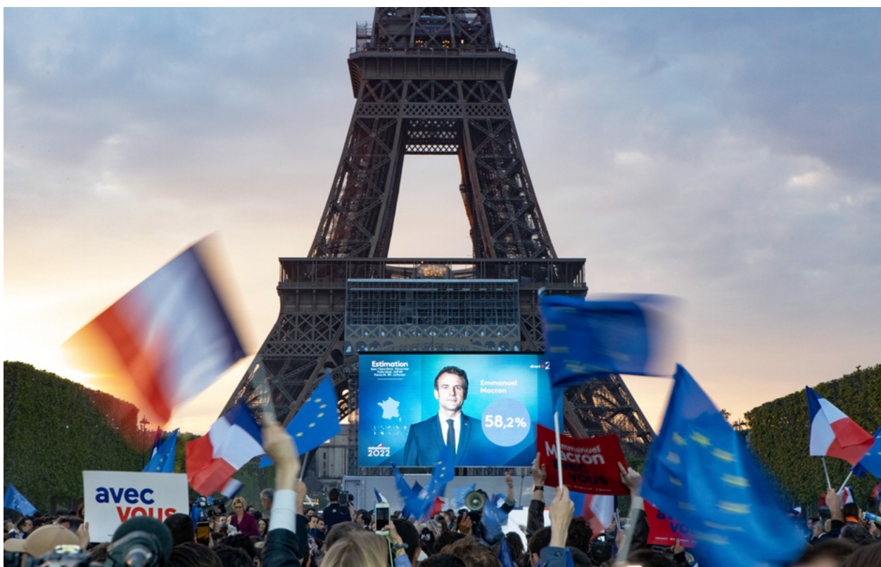
24 de abril de 2022, Francia, París: Partidarios del presidente francés Emmanuel Macron.

En segundo lugar, el sistema a dos vueltas produce la impresión de que el poder es inaccesible a los candidatos más o menos “alternativos”. Dicho en otras palabras: es un sistema conservador que generalmente favorece la victoria de candidatos “moderados” y hace muy difícil que candidatos que producen una marcada “reacción electoral” lleguen a las instituciones. Así, paradójicamente, a la mencionada fortaleza política e institucional le acompaña una debilidad social: una parte muy considera-