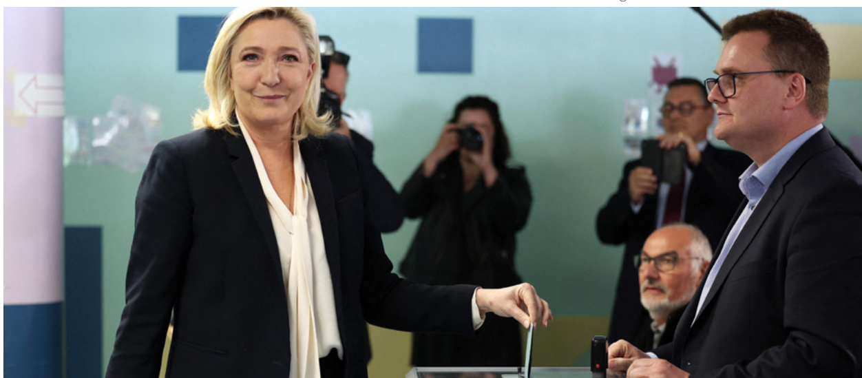
Marine Le Pen vota en la segunda vuelta de las elecciones francesas.

más poblados: obtiene hasta un 85,1% en París, un 79,8% en Lyon, un 81,2% en Nantes, un 80,1% en Burdeos, un 77,7% en Estrasburgo, un 77,5% en Toulouse, o un 76,6% en Lille. Los únicos núcleos urbanos importantes que se resisten relativamente a esta tendencia son los de la costa mediterránea, una región donde las tensiones con la inmigración hace tiempo que han orientado a los votantes hacia la derecha. Así, en Marsella, Macron se impone 'solo' con un 59,8%, y en Niza con un 55,4%. Por su parte, Marine Le Pen obtiene sus mejores resultados en las localidades pequeñas: es capaz de imponerse en la segunda vuelta en el 15,3% de las ciudades de entre 50.000 y 100.000 habitantes, en el 17,1% de los territorios con entre