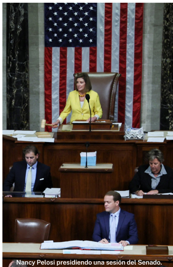
Nancy Pelosi presidiendo una sesión del Senado.

Para el Partido Republicano conseguir la mayoría en el Senado supondría una ventaja estratégica, si se le añade la mayoría en la Cámara de Representantes. Tendría el control de ambas cámaras del Congreso y con ello la capacidad de obstaculizar el resto del mandato del presidente Biden y sus planes legislativos. No obstante, la posibilidad de que ello ocurra es muy reducida. Sería necesario un cambio de sentido en las encuestas para que los republicanos se hicieran con dos escaños más de los que poseen actualmente.