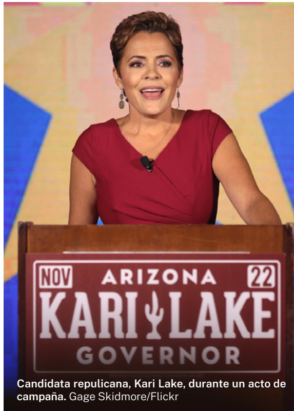
Candidata republicana, Kari Lake, durante un acto de campaña.

esperar en las elecciones presidenciales que se celebrarán en 2024. Sin lugar a duda, los gobernadores electos influirán en los resultados de 2024. De éstos dependerán futuras modificaciones de las leyes electorales estatales que podrían ampliar o reducir el número de votos válidos y beneficiar a un partido u otro.