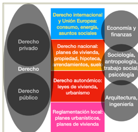
Figura 1. La complejidad de la vivienda, como disciplina y como política.

porque a menudo las conclusiones a las que llegan estos trabajos no las “compra” nadie.