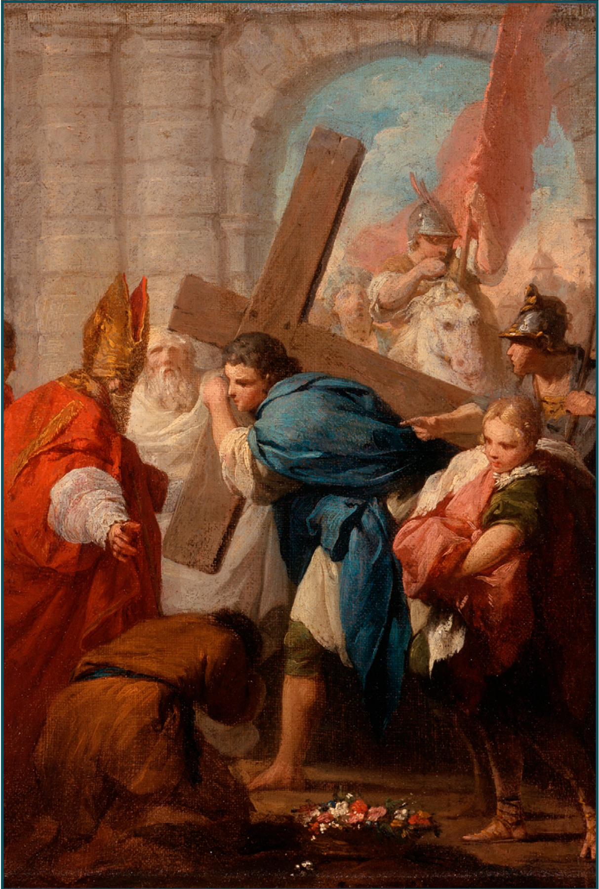
El emperador Heraclio devolviendo la Vera Cruz a Jerusalén, tras haber sido arrebatada por los persas | Pierre Subleyras