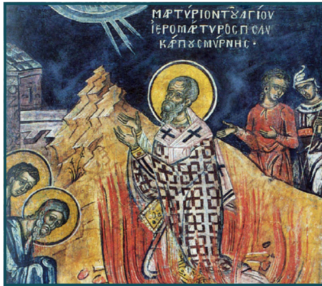
Martirio de San Policarpo, fresco del monasterio del monte Athos.

Y ningún cristiano, por cierto, le hizo ascos a Constantino por el hecho de que no estuviese bautizado (no recibiría tal sacramento hasta poco antes de fallecer). Parece que ya entonces la idea de que la Cristiandad podía contar con defensores no cristianos se captaba sin mayores estrépitos. A veces, la generosidad no consiste solo en acompañar dos millas a quien nos pide que le acompañemos una, sino en dejarnos acompañar una milla por quien, al fin y al cabo, en medio de agresivos pagos, comparte destino con nosotros.