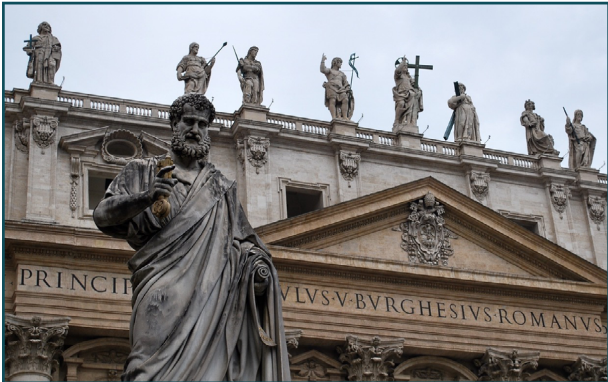
San Pedro del Vaticano.

funcionariado, fuerzas del orden. Mientras ellos permanezcan, nuestra civilización sobrevivirá.