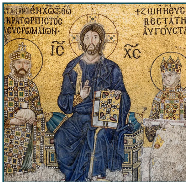
Cristo Pantocrátor entre el emperador Constantino IX Monómaco y la emperatriz Zoe (siglo XI), Santa Sofía, Estambul.

Se trata de un modelo de civilización alternativo porque desea (y de ese verbo recibe