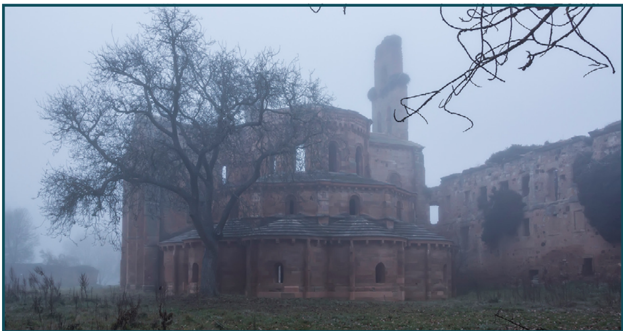
Ruinas del monasterio de Santa María de Moreruela, Zamora.

Queda por tratar, en cualquier caso, otros dos conjuntos: el de aquellos que no comulgamos con la idea de que se haya acabado la Cristiandad, y el de aquellos a los que nos parecería una pésima noticia que tal final se