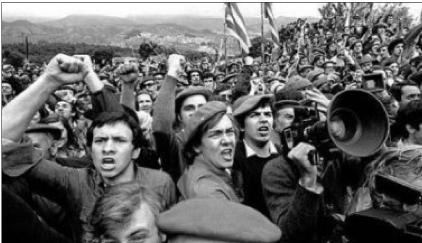
Miembros del partido carlista durante la manifestación de Montejurra.

desarmada de ETA ha triunfado por completo. 6