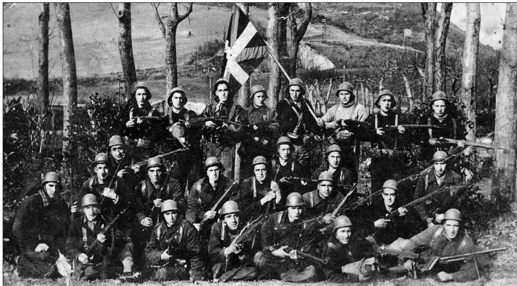
Soldados del Batallón Amaiur compuesto por vecinos de Gabiria en Vizcaya en 1937.

El primer atentado mortal se produce el 5 de julio de 1975 contra Carlos Arguimberri Eloorriaga, de 43 años, natural de Deva y soltero. Hombre pacífico y sin que le caracterizase un gran apasionamiento político; siempre dispuesto a hacer favores, y muy apreciado por los vecinos. Pertenecía a una destacada familia carlista y vascoparlante y había trabajado de zapatero y de conductor