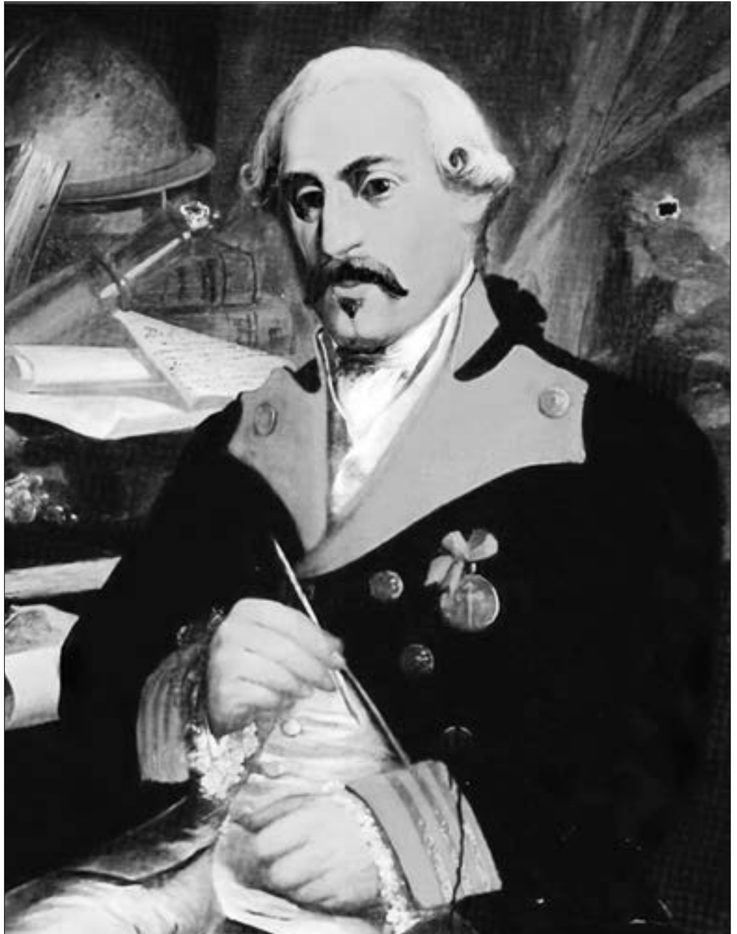
Retrato de José Cadalso (1855) por Pablo de Castas Romero. Museo de las Cortes de Cádiz.

Azorín tenía en parte razón, pues Noches lúgubres -compuesta entre 1771 y 1774- tiene elementos distintivos de esa literatura tenebrosa, oscura, onírica y fantástica, nocturna y melancólica, que caracterizan la Weltanschauung romántica. Pero no se puede reducir a Cadalso solo a ese estilo literario, pues su vida y obra fueron la