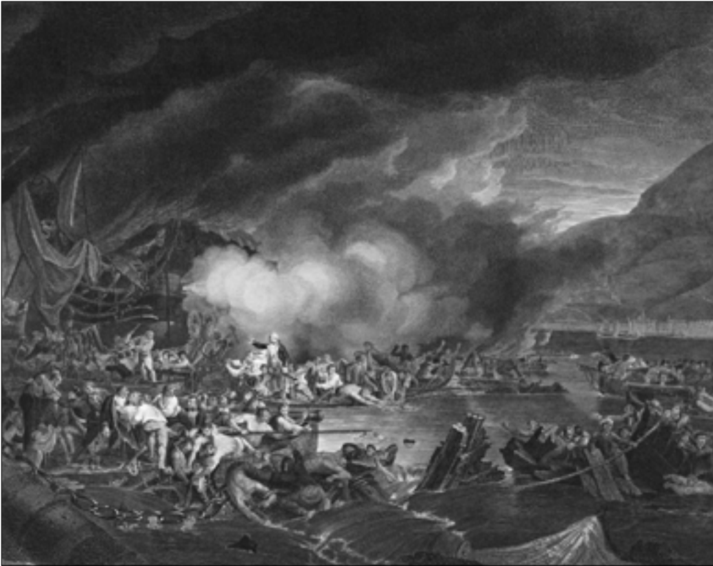
Gibraltar en la mañana del 14 de septiembre 1782 obra de James Jefferys que muestra la llegada de heridos provenientes de las baterías flotantes a Gibraltar.

arte. A Noches lúgubres le siguieron Cartas marruecas o Los eruditos de la violeta , en la que critica la erudición superficial de la que hacía gala una parte de la sociedad española.