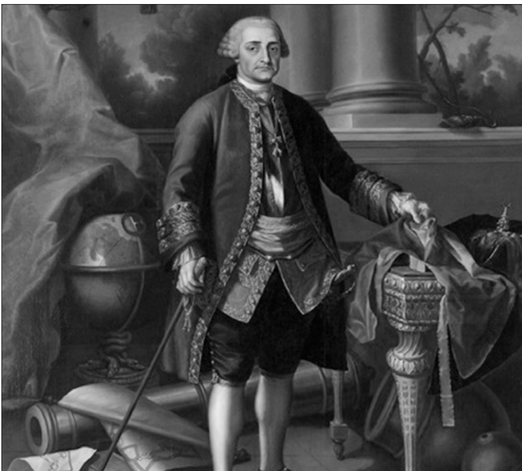
Pedro Pablo Abarca de Bolea, X Conde de Aranda. Ramón Bayeu (1769). Museo de Huesca.

Habiéndose percatado del reto histórico al que se enfrentaba España, Aranda mismo