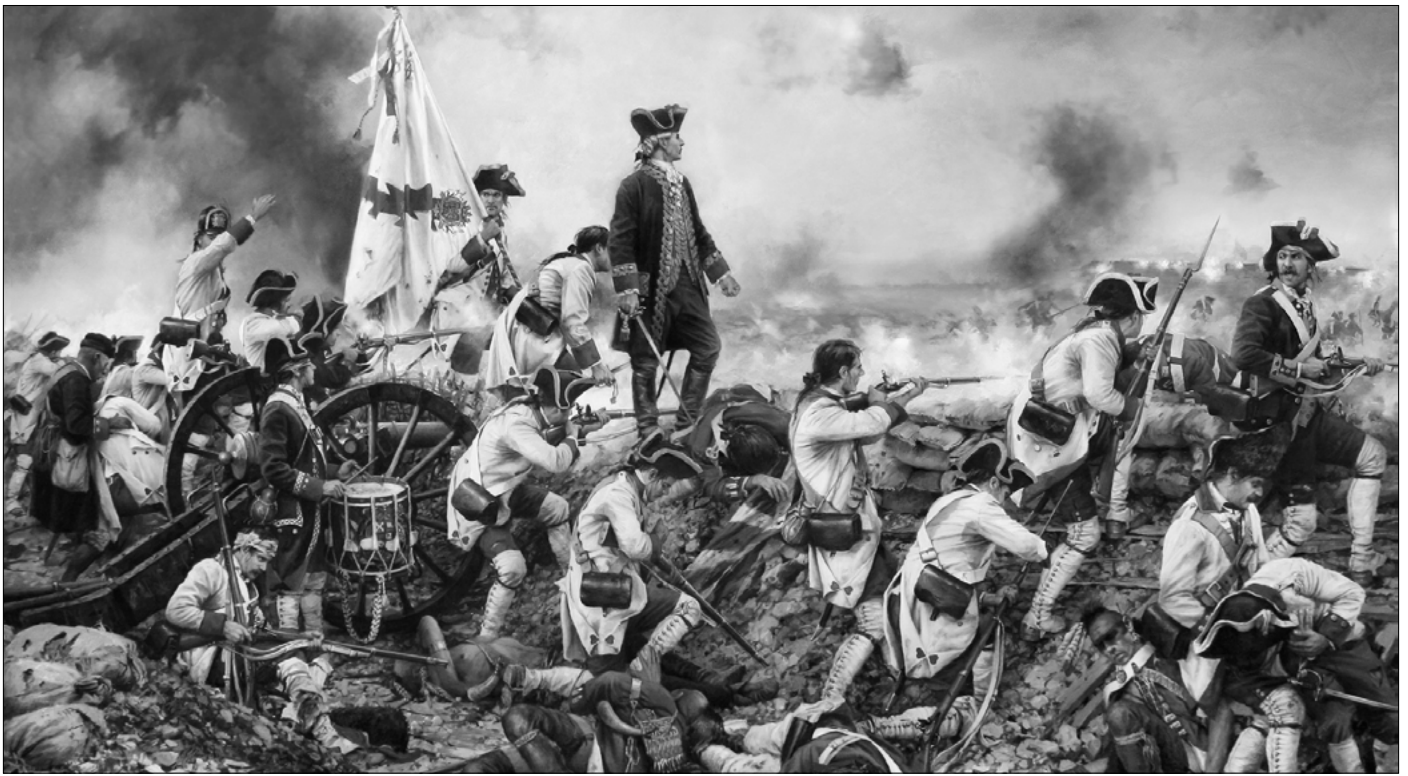
Por España y por el rey, Gálvez en América. Cuadro de Augusto Ferrer-Dalmau.