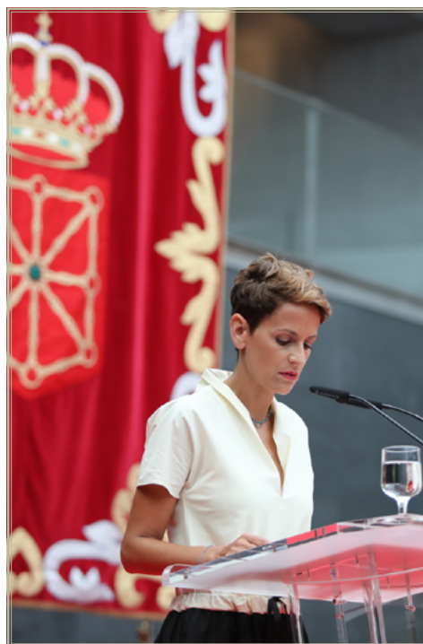
María Chivite, durante su discurso de toma de posesión del cargo en el Parlamento de Navarra.

la abstención del PSN-PSOE y los votos en contra de UPN. Cuatro años después, y pese a que Navarra Suma ganó los comicios, con 19 parlamentarios, la abstención de Bildu y el apoyo de Geroa Bai! y Podemos invistieron como presidenta del ejecutivo foral a María Chivite, del PSN-PSOE, que solo había obtenido 11 escaños. ¿Cuál será el peaje que habrá que pagar a los independentistas? La decisión del presidente del Gobierno, Pedro Sánchez, de aceptar el apoyo de Bildu para perpetuarse en La Moncloa y sacar adelante los Presupuestos Generales del Estado y su pacto con el PNV no preludian nada bueno, como se verá en el apartado PNV, la permanente llave de la gobernabilidad .