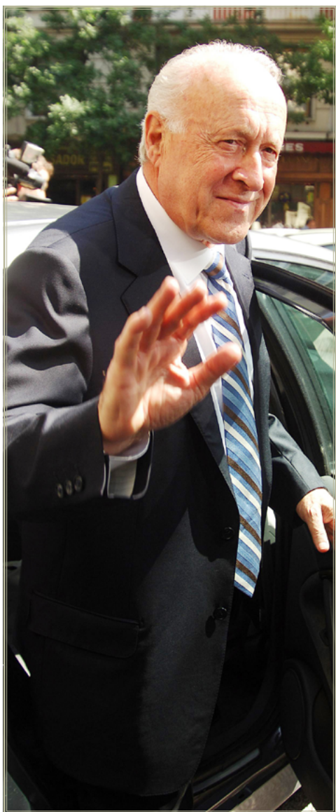
El ex líder del PNV, Xabier Arzalluz, a la salida de la Audiencia Nacional en junio de 2006.

lo queremos y no sería bueno para Euskal Herria”, añadió Arzalluz en aquel siniestro encuentro.