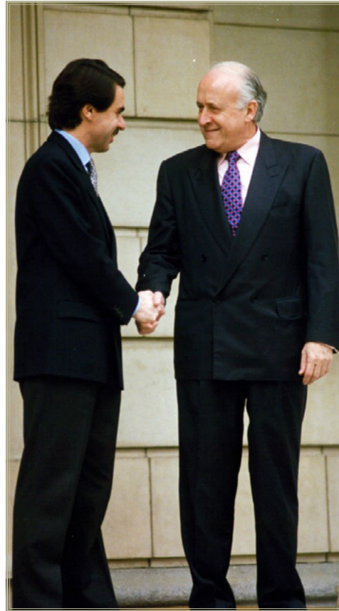
El presidente del Gobierno, José María Aznar, recibe al presidente del PNV, Xabier Arzalluz.

A la vista está que el PNV es un socio muy poco fiable, pero cuando se ofrece al mejor postor, fuera antes UCD y ahora PSOE o PP, el pretendiente a ocupar La Moncloa, o a mantenerse allí, acaba poniéndose a sus pies. “Ellos no se fían de nosotros, hacen que sí, pero no, y a veces se les escapan cosas significativas”, solía comentar Arzalluz en conversaciones privadas. Ni tan siquiera la crisis en la que entró el bipartidismo, con la irrupción de Podemos y Ciudadanos y, posteriormente, de Vox, ha arrebatado al PNV, de momento, su papel de partido bisagra. “Somos influyentes en Madrid, no hemos perdido influencia allí, a pesar de nuestra pequeñez”, se jactaba durante la asamblea general del PNV del 28 de noviembre del 2021 el dirigente nacionalista Andoni Ortuzar para quien su partido “da estabilidad allá donde está”. Ya demostró durante la II República que era capaz de poner una vela a Dios y otra al Diablo y al final se la puso al Frente Popular para sacar adelante el Estatuto de Autonomía.