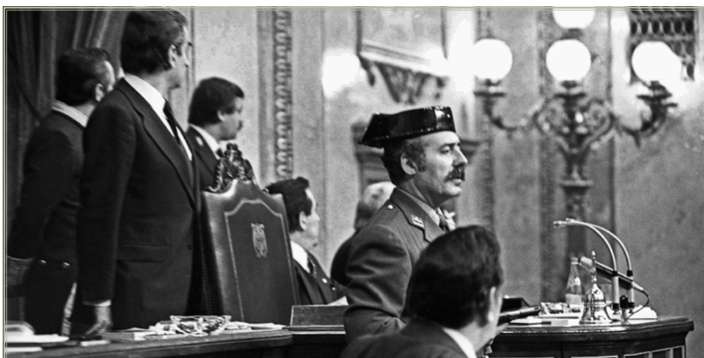
El teniente coronel de la Guardia Civil, Antonio Tejero, accede al Congreso de los Diputados durante la segunda votación de investidura de Leopoldo Calvo Sotelo como presidente del Gobierno.

Había que enmendar el caos autonómico e impedir que se vaciara al Estado de competencias claves, tras las importantes cesiones de Suárez a los nacionalistas, especialmente a los vascos.