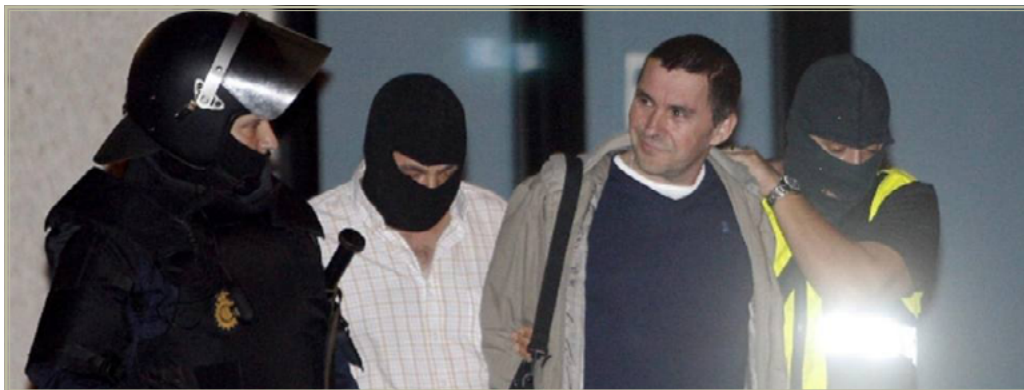
Arnaldo Otegui, actual dirigente de Bildu.

El nacionalismo en general, y el vasco muy en particular, tienen la habilidad de atribuir al Gobierno central todos los males que acechan a la sociedad, pese a su elevada cuota de competencias en importantes materias que afectan directamente a los ciudadanos. Sin embargo, muestra la misma destreza para auto colgarse todas las medallas en aquello que va bien. Así las cosas, el PNV se convierte en un interlocutor imprescindible con quien inevitablemente ha de ponerse de acuerdo el Gobierno de España, aún en el breve periodo de tiempo en que en la Comunidad Autónoma del País Vasco gobernó el PSE con el apoyo del PP.