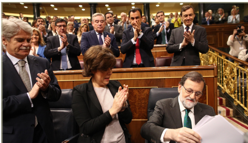
Mariano Rajoy durante la moción de censura presentada por el candidato socialista, Pedro Sánchez.

Durante su investidura, Pedro Sánchez calificó al PNV como “socio preferente”. Quizá, sería más propio decir que el PSOE era un “socio preferente” para el PNV porque ese apoyo dejó vía libre a los nacionalistas para apropiarse de una auténtica mina que, si la siguen explotando, les va a proporcionar mucha renta, política y económica. El documento firmado por Sánchez y el PNV plantea la transferencia de numerosas competencias de gran calado