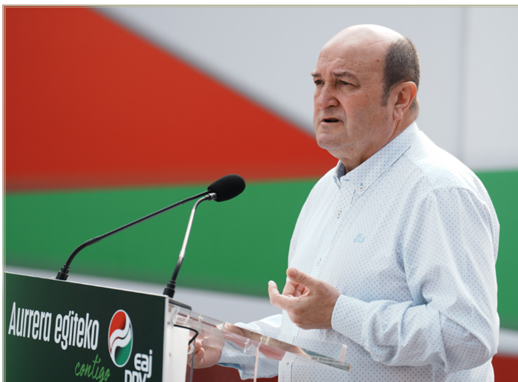
Presidente del Euzkadi Buru Batzaren (EBB) y del Partido Nacionalista Vasco (PNV), Andoni Ortuzar.