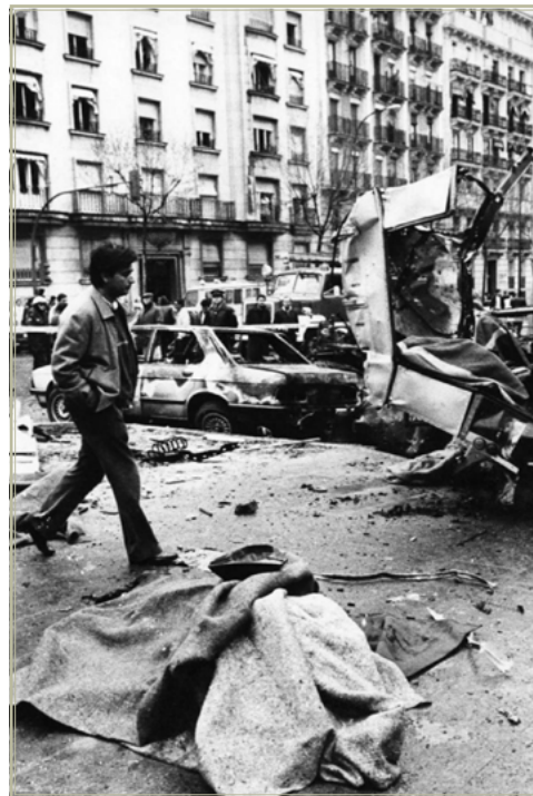
Atentado de ETA en la calle Juan Bravo (Madrid).

después de la ignominia de Vergara, el PNV formaba un gobierno de coalición con el PSE, que había ganado por muy escaso margen las elecciones autonómicas, mientras apoyaba esporádicamente al ejecutivo de Felipe González. Como se ha dicho, una vela a Dios y otra al diablo. Sí, porque los contactos entre nacionalistas y batasunos continuaron. Eso tampoco debió ser motivo suficiente para que, entonces el PSOE, y más tarde PP, siguieran acudiendo al PNV como uno de sus socios preferentes.