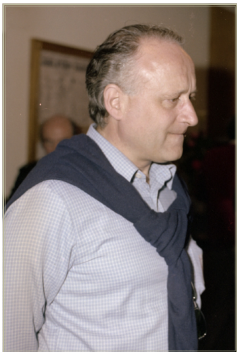
Xabier Arzalluz en la inauguración del batzoki de Oñate (13 de mayo de 1979).

El PNV siempre ha defendido la negociación política como fórmula para acabar con el terrorismo y ha rechazado la vía policial, consciente de que con ETA derrotada, la Administración Central dejaría de privilegiar al nacionalismo vasco. Esto es, según las pretensiones del PNV, primero deben conseguirse todas las reivindicaciones, incluida la autodeterminación, y después ya se silenciarán las armas, como consecuencia de unas demandas satisfechas. “En Moncloa solo se piensa en derrotar y liquidar a ETA. ¿Ustedes creen que, aunque se acabe ETA, se acabó el problema?, declaró Arzalluz