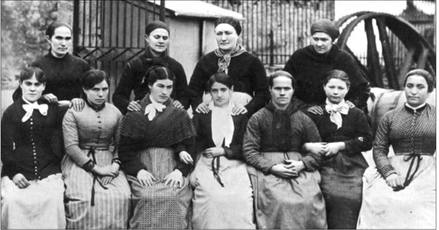
Mujeres obreras de Villava a finales del siglo XIX.