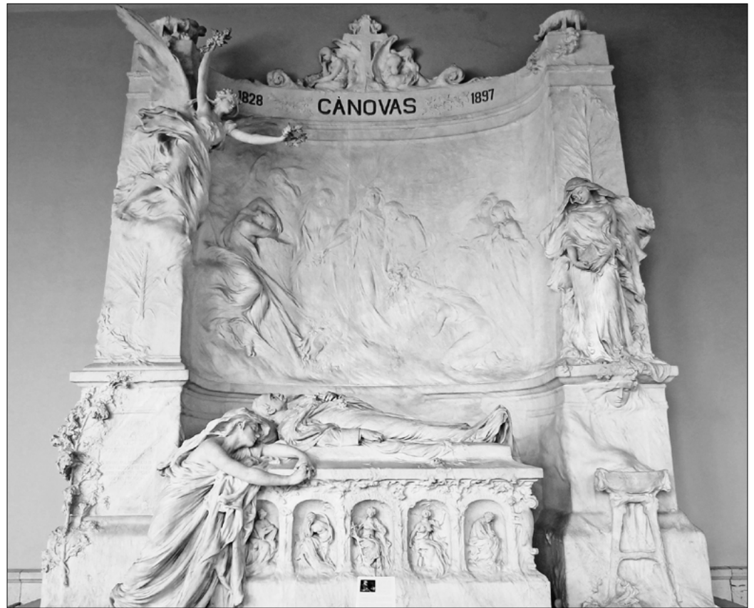
Mausoleo de Cánovas del Castillo. Agustín Querol (1906). Panteón de los Hombres Ilustres, Madrid.

Es decir, que al mismo tiempo que abogaba por que las provincias pudieran administrar sus