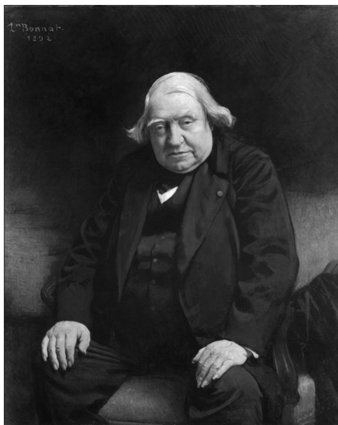
Ernest Renan. Léon Bonnat (1892). Ernest Renan Museum, Tréguier (Francia).

Esa voluntad colectiva ni siquiera era posible captarla con el sufragio porque no había «nada más difícil que una suma en que, por oposición a la ley aritmética, ningún sumando [entre personas distintas] puede reputarse homogéneo, puesto que cada uno de por sí es autónomo, en cada uno cabe determinación peculiar y diferente, y sobre cada cual obran causas determinantes de diversa naturaleza» 9 .