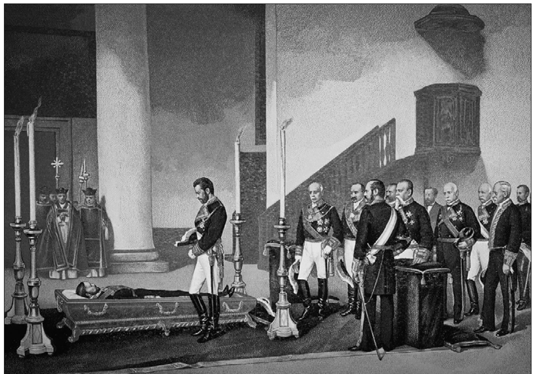
Amadeo I contemplando el cadáver del general Prim. Antonio Gisbert (1875). Museo de Historia de Madrid.

“El Ejército español del XIX respondía a una unidad profunda que no se correspondía con el pluralismo de sus cabezas visibles. Esta unidad profunda resultó decisiva para superar las crisis inmediatas al destronamiento de Isabel II. En primer lugar, se evitó la reincidencia en fórmulas de Ejército popular análogas a