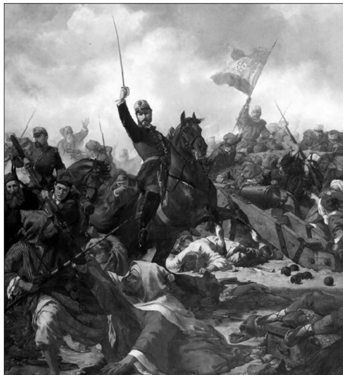
El general Prim en la Guerra de África. Francesc Sans Cabot (1865). Palacio de la Capitanía General (Barcelona).

fue el periodo de su paso por el Gobierno de España, primero como ministro de la Guerra y después como presidente del Consejo de Ministros -poco más de dos años-, Prim es considerado por muchos de sus biógrafos como un estadista, incluso como un gran estadista a pesar de la brevedad de su mandato y de que su obra, finalmente, no perduró, en parte por su muerte a causa de un atentado. En lo que más demostró que era un estadista fue en su constante promoción de los valores de la Monarquía, cuestión que, en ocasiones, no se ha subrayado suficientemente en la historiografía cuando es lo que lo define. Como explica José María Michavila, Prim siempre se manifestó partidario de la Monarquía, lo que le trajo grandes problemas con posibles aliados políticos,