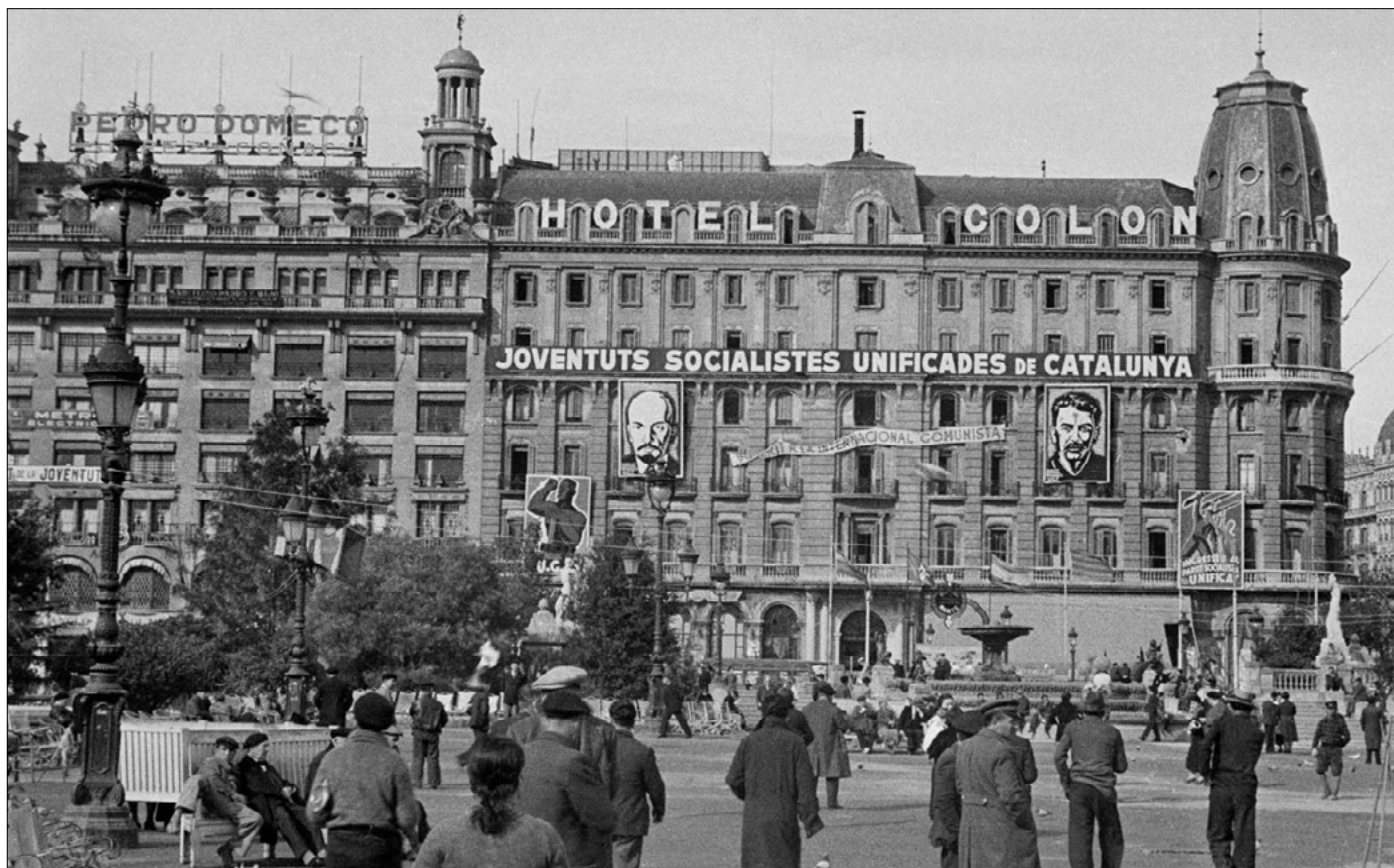
Sede del PSUC en el Hotel Colón de Barcelona, noviembre de 1936.

Finalizada la Guerra Civil, el socialismo catalán se organizó en el exilio, creando en 1941 el Partit Socialista Català, en México, y el Moviment Socialista de Catalunya (MSC) el año 1945, en Francia. El Partit Socialista Català fue absolutamente insignificante, mientras que el MSC desarrolló una modesta