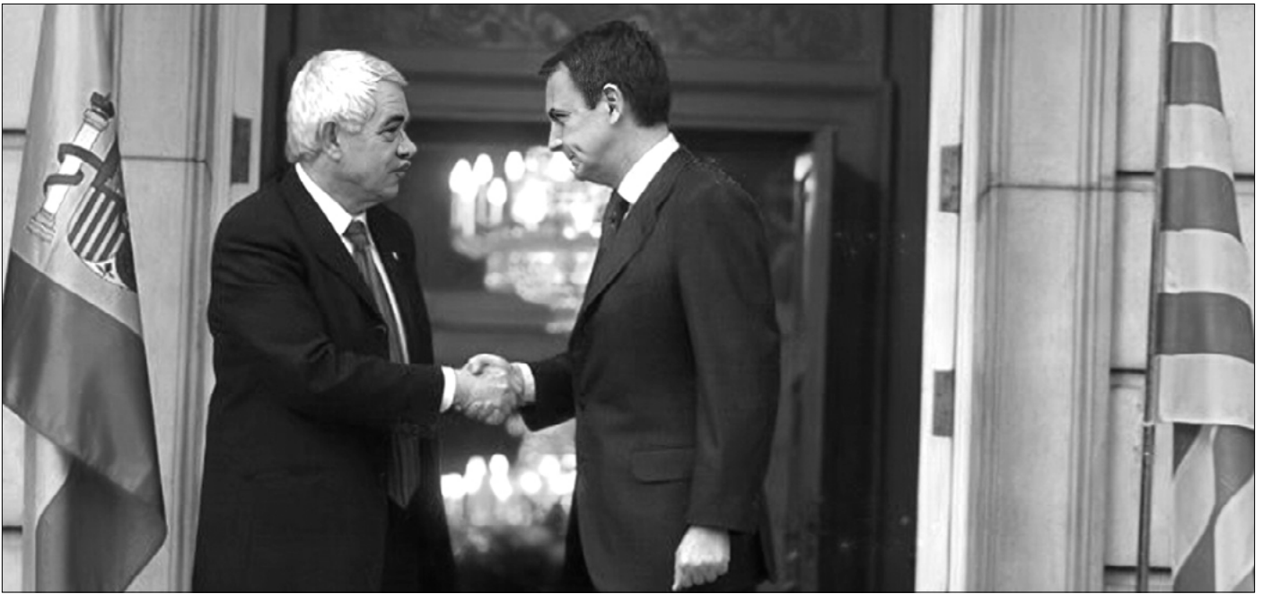
Pasqual Maragall y José Luis Rodríguez Zapatero, el 27 de enero del 2006.

socialistas catalanes desempeñaron a raíz el golpe de Estado del 1-O, buena muestra del maquiavelismo sin escrúpulos característico del PSC a lo largo de su existencia. En las autonómicas de 2017, el PSC optó por la cínica equidistancia y se presentó al electorado como el único partido capaz del diálogo, de la sensatez para reconducir el desastre provocado por los separatistas. El PSC había dado alas al procés separatista