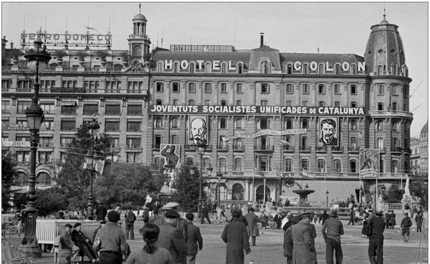
Sede del PSUC en el Hotel Colón de Barcelona, noviembre de 1936.

Finalizada la Guerra Civil, el socialismo catalán se organizó en el exilio, creando en 1941 el Partit Socialista Català, en México, y el Moviment Socialista de Catalunya (MSC) el año 1945, en Francia. El Partit Socialista Català fue absolutamente insignificante, mientras que el MSC desarrolló una modesta