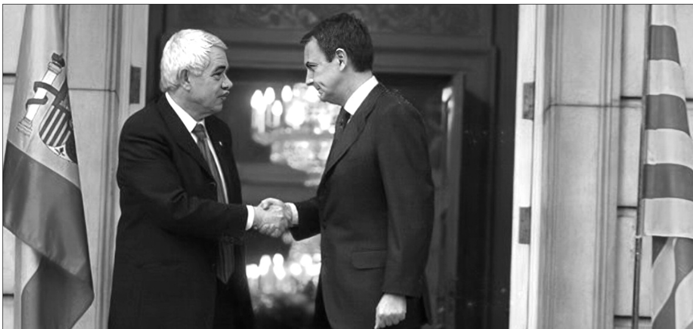
Pasqual Maragall y José Luis Rodríguez Zapatero, el 27 de enero del 2006.

socialistas catalanes desempeñaron a raíz el golpe de Estado del 1-O, buena muestra del maquiavelismo sin escrúpulos característico del PSC a lo largo de su existencia. En las autonómicas de 2017, el PSC optó por la cínica equidistancia y se presentó al electorado como el único partido capaz del diálogo, de la sensatez para reconducir el desastre provocado por los separatistas. El PSC había dado alas al procés separatista