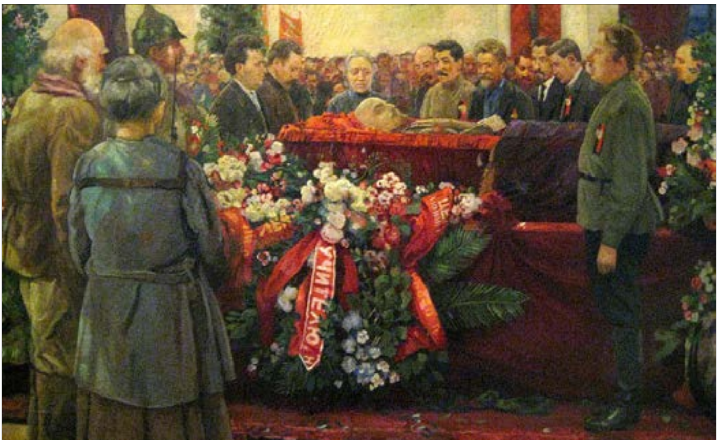
Funeral de Lenin. Isaak Brodsky (1925). Museo Estatal de Historia, Moscú.

“ repetir Lenin ”, e incluso sienten nostalgia de Stalin. Como movimiento político, Podemos y sus derivados han sido, y son, herederos de ese pathos revolucionario. Por todo ello, conviene estar alerta. Y es que, como señaló Raymond Aron, la Historia es “ la tragedia de una humanidad que hace su historia, pero que no conoce la historia que ella misma hace ”.