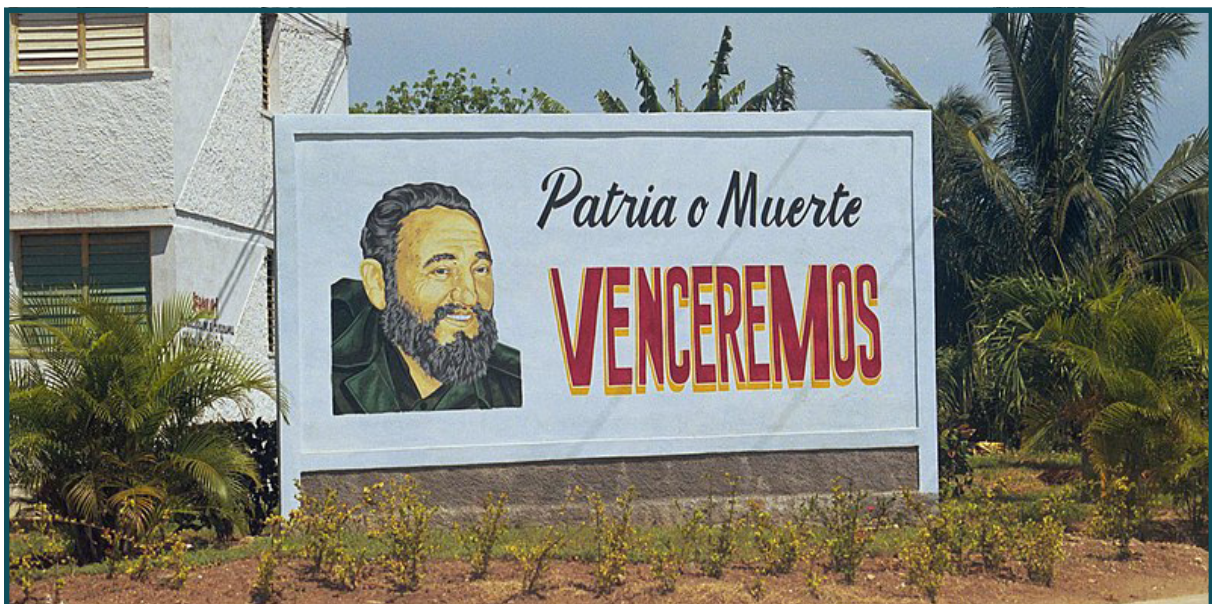
Cartel oficial de propaganda en Cuba, 2007.

¿Cuba renacerá algún día? No lo sé. Tengo la convicción de que ha sido demasiado largo para que, en caso de que la isla despierte de su letargo comunista, el cambio se produzca de manera sana y generosa. Sí, el horror ancló en la sociedad cubana, se arraigó en su idiosincrasia, y ha sido excesivamente duradero. Para mí toda una vida. Pero numerosas reencarnaciones acechan todavía, España es una de ellas.