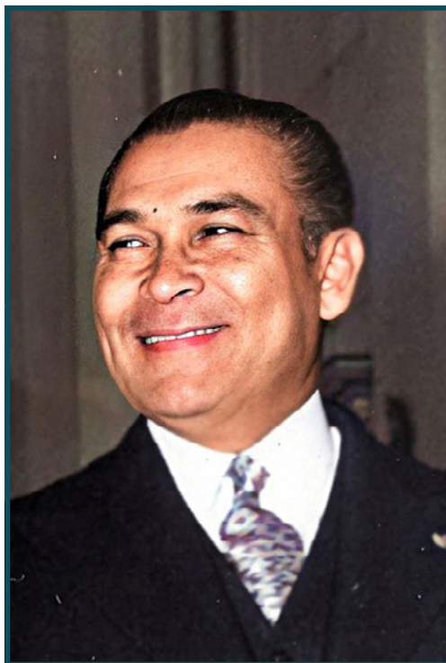
Fulgencio Batista en el año 1955.

En el macro tejido falsificado de esta tragedia han participado todos, pero principalmente una cierta burguesía cubana, hipócrita, racista, narcisista, y lo peor, ignorante. Una burguesía rapiñera que jamás toleró que un humilde campesino mestizo llegará a donde llegó, gracias a una formación autodidacta, la lectura y a su inmenso añoro de sabiduría y amor por Cuba. Su carácter sencillo molestaba a quienes fabricaban bibliotecas