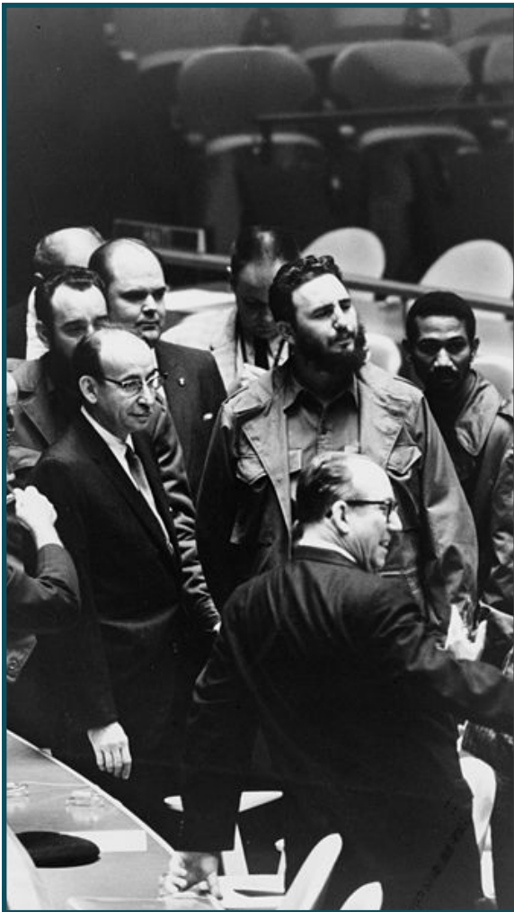
Fidel Castro en la Asamblea General de la ONU, el 22 de septiembre de 1960.

Poco tiempo después, Fidel traicionaría esa amistad con el filósofo francés, y por su parte, Jean-Paul Sartre rompió con él al enterarse de la cantidad de fusilamientos que cada noche se ejecutaban en la prisión de La Cabaña.