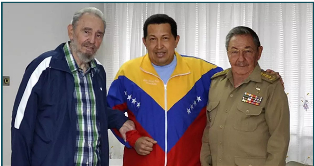
Fidel Castro, Hugo Chávez y Raúl Castro en el año 2011.

Pero volvamos a su impronta bonapartista, bolivariana y hitleriana. El sueño, o pesadilla para los que la hemos padecido, de Fidel Castro de extender la revolución castro-comunista hacia toda América Latina