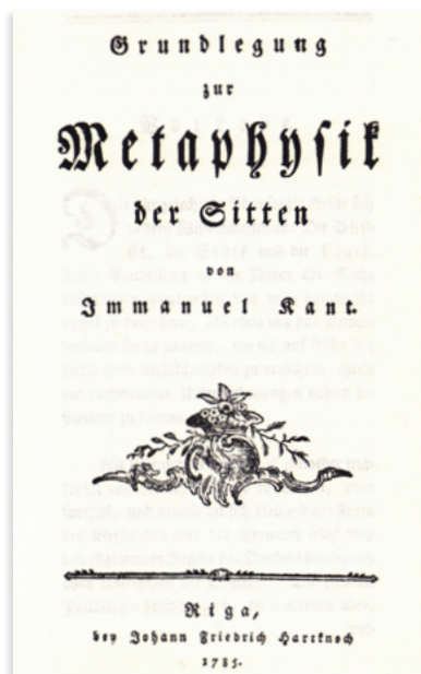
Primera página de Fundamentación de la Metafísica de las Costumbres de Immanuel Kant. Ejemplar impreso en 1785, Riga.

Kant debe su celebridad sobre todo a la teoría del conocimiento (sobre eso trata la Crítica de la Razón Pura ), pero diría que sus aportaciones más interesantes y perdurables guardan relación con la ética y la teología ( Fundamentación de la Metafísica de las Costumbres , Crítica de la Razón Práctica ). Aunque admirador de Hume, Kant no podía aceptar la radicalidad empírico-escéptica de una perspectiva que reducía todo conocimiento a las impresiones e imposibilitaba los juicios sintéticos (es decir, aquellos en los que el predicado añade al sujeto algo que no estaba ya en este; por ejemplo, ‘ el sol sale todos los días ’ es un juicio sintético, mientras que ‘ el triángulo tiene tres lados ’ es un juicio analítico, una tautología) de validez universal: no podemos, según Hume,