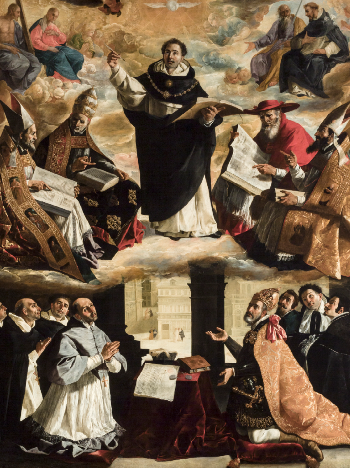
Apoteosis de Santo Tomás de Aquino . Francisco de Zurbarán (1631). Museo de Bellas Artes de Sevilla, España.