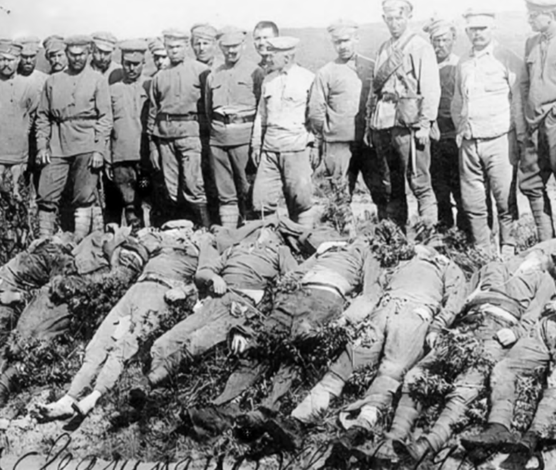
Checoslovacos víctimas de los bolcheviques cerca de Vladivostok. Fotografía de William C. Jones (1918). Fuente: Wikipedia.org