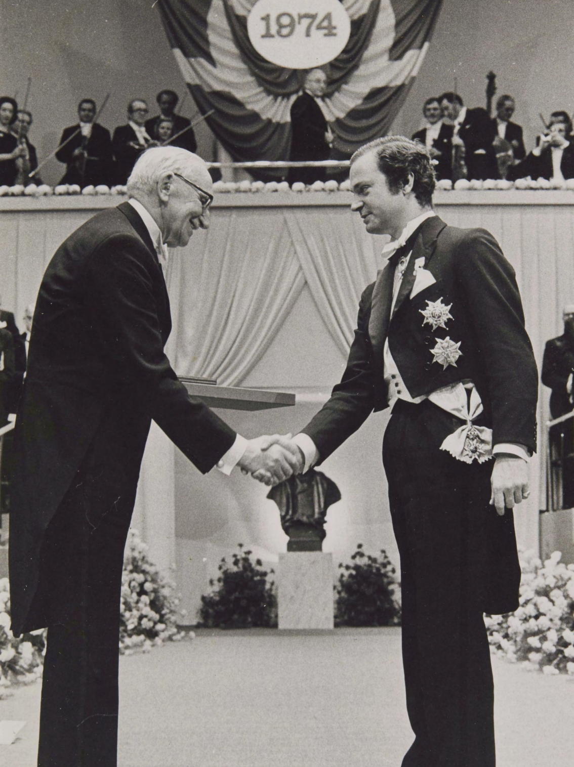
F. A. von Hayek durante la recepción de su Premio Nobel de Economía en 1974.