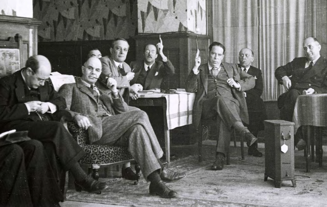
Miembros de la Sociedad Mont Pélerin en su primera reunión en 1947.